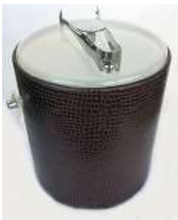
Balde gelo com pegador – 1 unid.