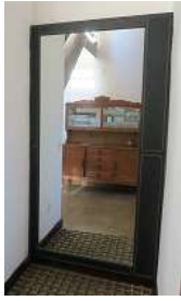
Espelho moldura couro 1,20 x 2,20 m – 1 unid.