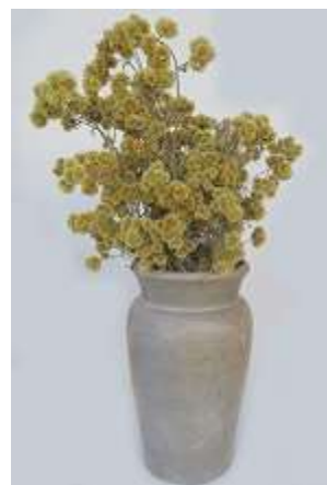
Vaso Pedra Sabão – 1 unid.