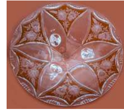
Fruteira Cristal – 1 unid.