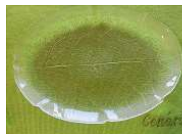
Travessas Arcoroc – 5 unid.