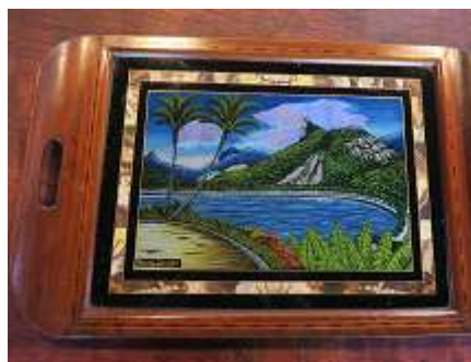
Bandeja Rio de Janeiro – 2 unid.