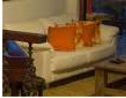
Sofá 3 Lugares em couro branco – 1 unid.