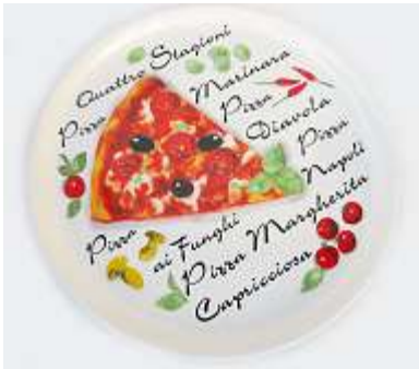
Prato Pizza – 1 unid.