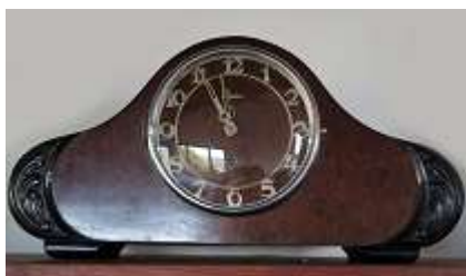
Relógio Regina em madeira – 1 unid.