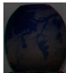
Pote Cristal Azul – 1 unid.