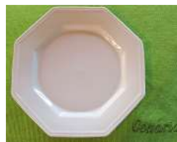
Prato Branco – 11 unid.