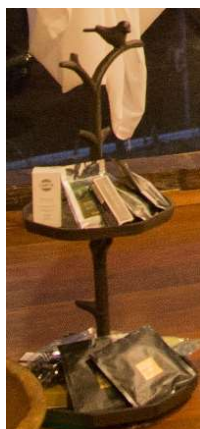
Suporte decorativo ferro fundido c/ pássaros – 1 unid.