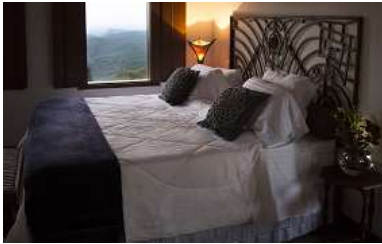
Cama Super King – 2 unid.