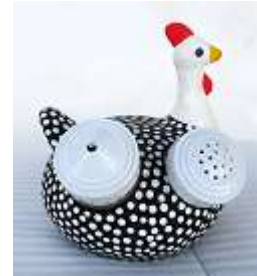
Porta palito e saleiro galinha da angola – 1 unid.