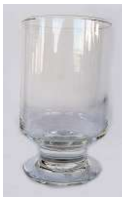
Taça Água – 24 unid.