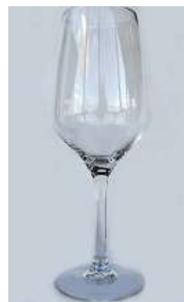
Taça Champanhe Normal – 12 unid.