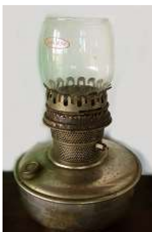
Lampião vidro incolor – 1 unid.