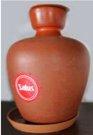
Moringa Salus – 1 unid.