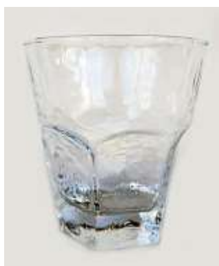
Copo Whisk – 6 unid.