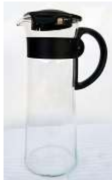
Garrafa para suco – 1 unid.