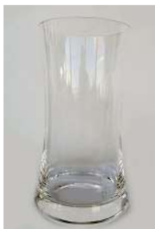
Copo Longo – 13 unid.