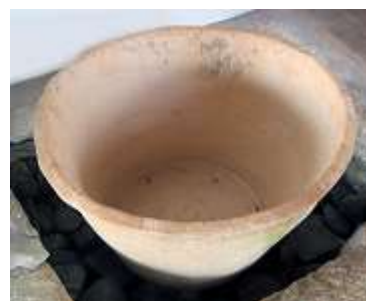
Pote Barro grande – 1 unid.