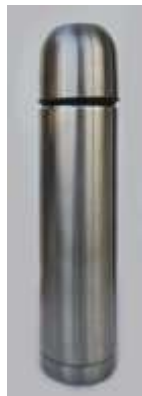
Garrafa Térmica Café Inox- 1 unid.