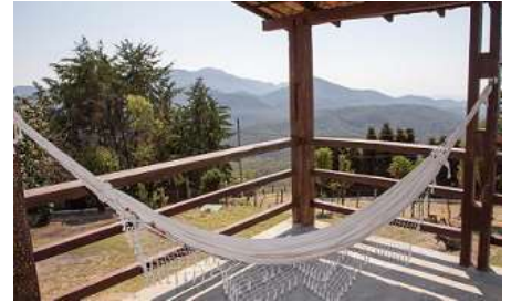
Rede em Pano – 1 unid.