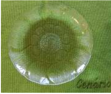
Prato Almoço Arcoroc – 12 unid.