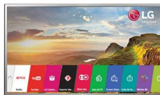
TV LG 32” Smart – 4 unid.