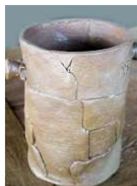
Vasos cerâmica Mario Tolda – 3 unid.