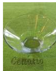
Taça Sorvete – 6 unid.