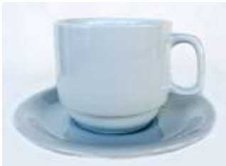
Xícara Café – 12 unid. Pires Café – 12 unid.