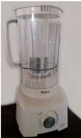
Liquidificador Philco – 900 W – 1 unid.