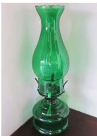
Lampião vidro verde – 2 unid.