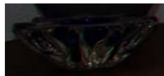
Cinzeiro Cristal Azul – 1 unid.