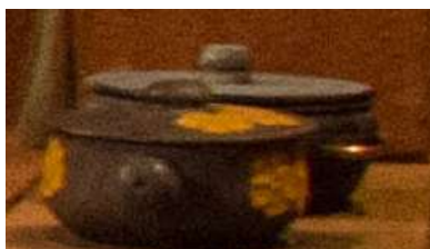
Panela Média de pedra – 1 unid.