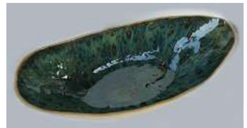
Vaso cerâmica verde – 1 unid.