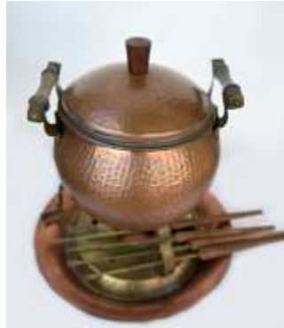
Kit Fondue Cobre c/ 4 espetos – 1 unid.