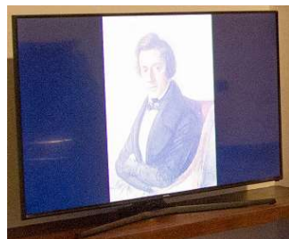
TV Samsung 48” Smart – 1 unid.