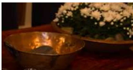
Tacho Cobre – 4 unid.