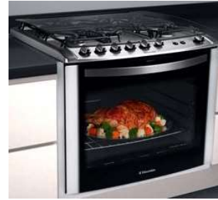
Fogão eletrolux 5 Bocas c/ forno grill – 1 unid.