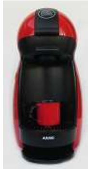
Cafeteira Dolce Gusto – 1 unid.