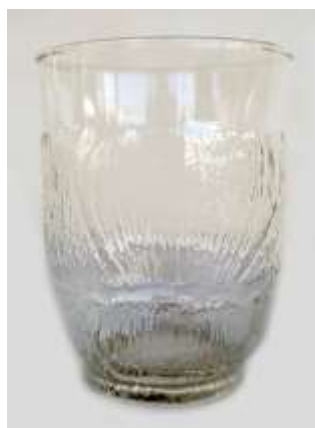
Copo Água Arcoroc – 9 unid.