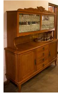
Cristaleira espelhada – 1 unid.