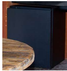
Freezer Frigobar – Consul – 1 unid.