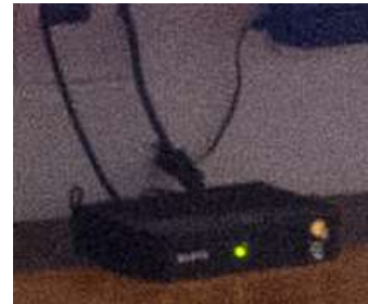
Decodificador Satélite Oi Tv Livre – 5 unid.