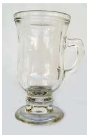
Taça Cappuccino – 5 unid.