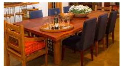
Mesa almoço c/ 8 cadeiras – 1 unid.