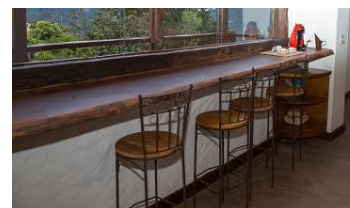
Pranchão sala almoço com 4 banquetas – 1 unid.