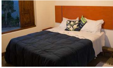
Cama Queen – 3 unid.