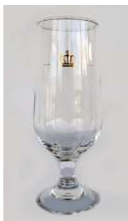
Taça Champanhe Caras – 2 unid.