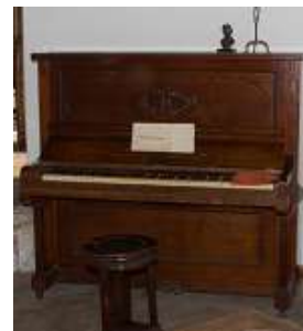
Piano alemão em madeira com banco – 1 unid.