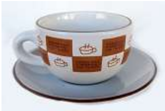
Xícara Espresso – 6 unid.